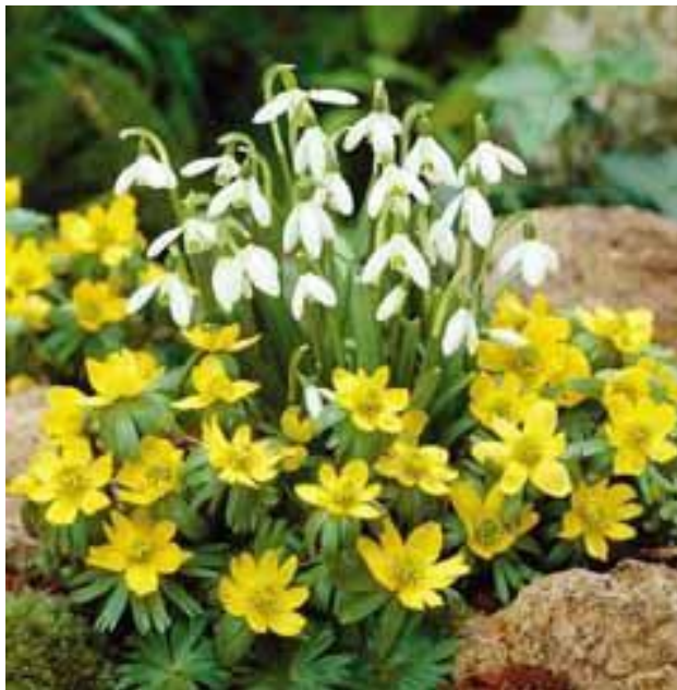
Snowdrops dari the Bield—Perth, Scotland

Momen unik ini di planet kita ketika keluarga manusia dapat menjadi lebih sadar tentang kebesaran hati dan jiwa, "Di seluruh dunia, orang terbangun pada realita baru, pada seberapa agungnya kita...pada apa yang benar-benar berarti, untuk mencinta"